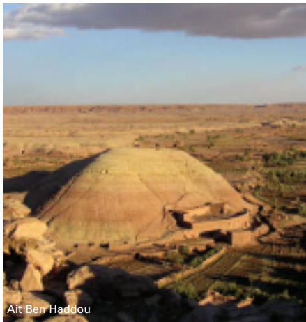
Ait Ben Haddou